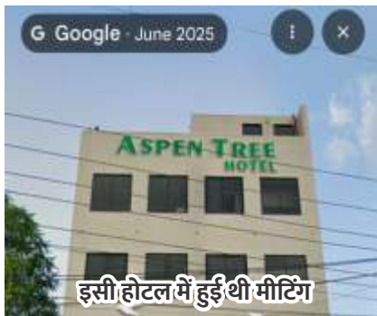
इसी होटल में हुई थी मीटिंग